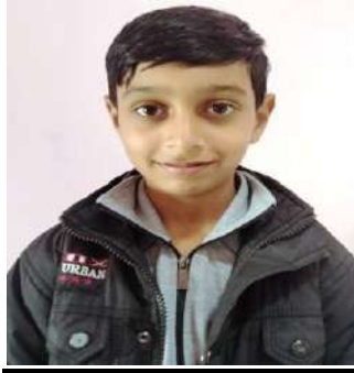
SURYAKANT STATE PLAYER SELECTION IN LAWN TENNIS