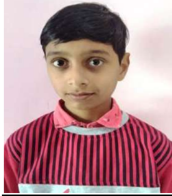
SURYAPRATAP STATE PLAYER SELECTION IN LAWN TENNIS