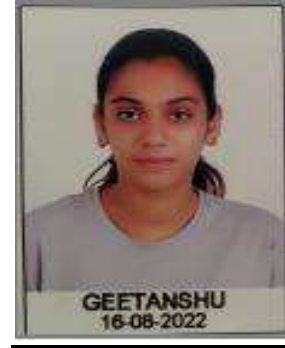
GEETANSHU STATE PLAYER SELECTION IN LAWN TENNIS